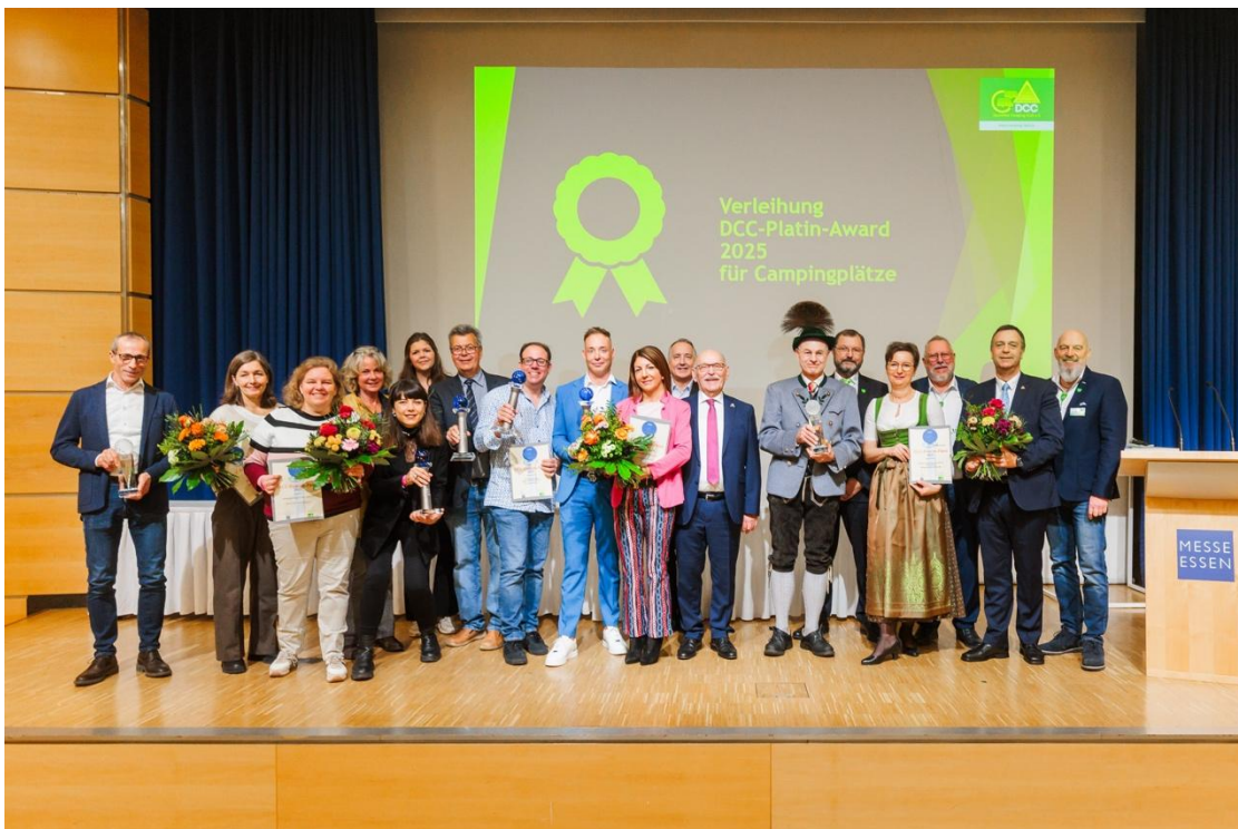
Vítězové ceny DCC

The DCC Platinum Award byl předložen Alpen-Caravanpark Tennsee/Německo a Hells Holiday Resort/Rakousko.