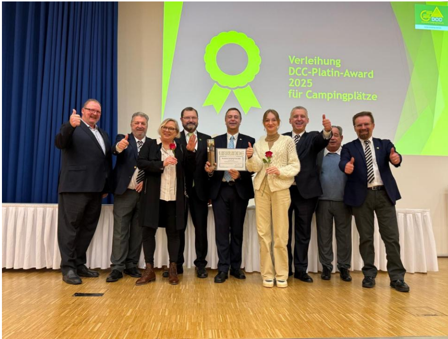
Rada FICC a dámy ze sekretariátu FICC v Essenu.