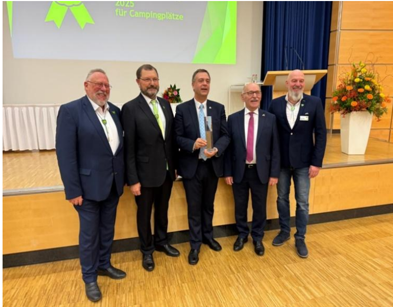
Výbor DCC, prezident FICC, starosta Essenu