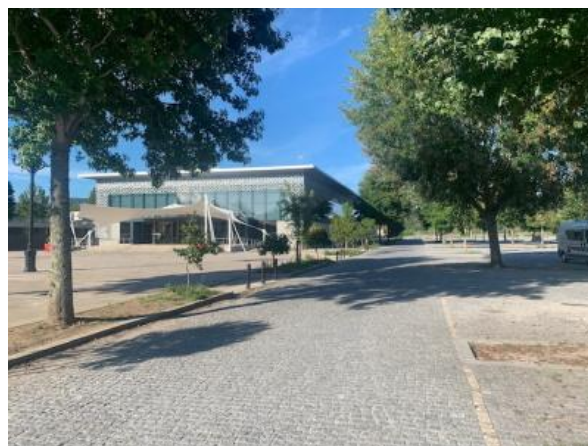
K dispozici je bezplatné parkoviště poblíž centra města