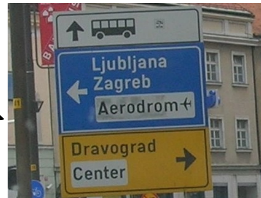
Odbočte vpravo na Dravograd