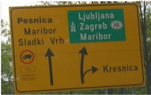
Držte se vlevo – směr Pesnica / Maribor