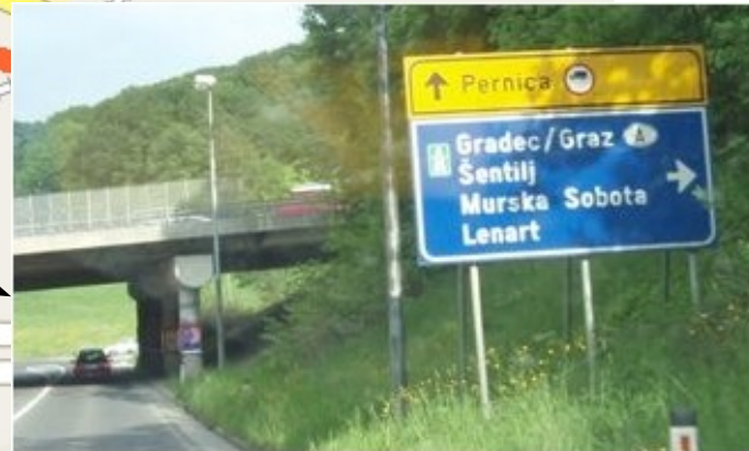
Odbočte vpravo na Šentilj (viz. poznámka č.1)