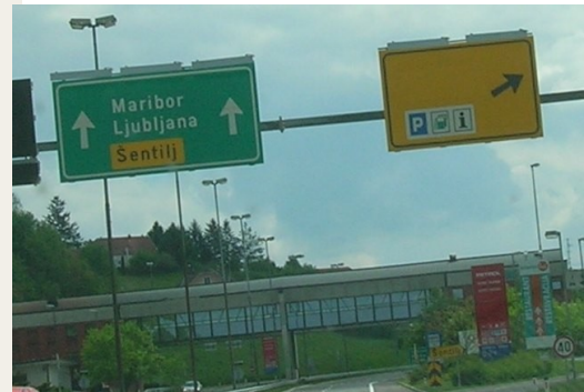
Jestliže jste neodbočili u exitu na Spielfeld, řiďte se záhadně prázdnou žlutou značkou