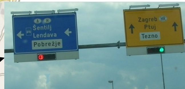
Držite se vpravo – směr Zagreb / Ptuj