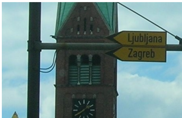
Odbočte vlevo na Zagreb / Ljubljana