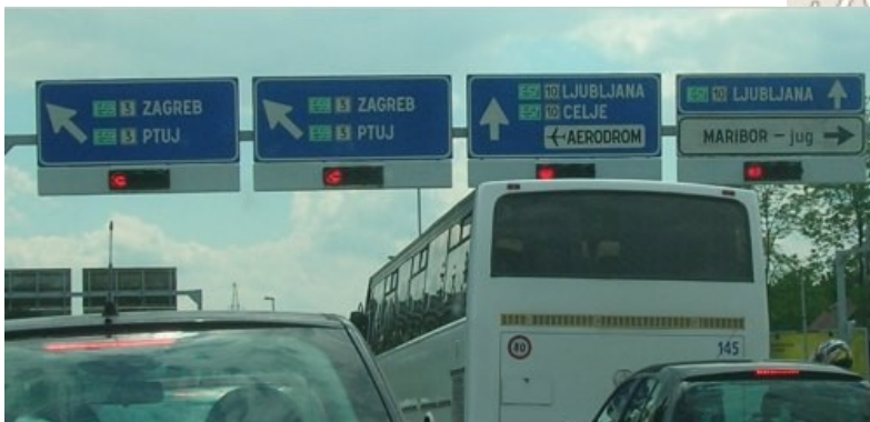
Odbočte vlevo na Zagreb / Ptuj (viz. poznámka č. 2)