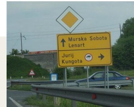
Odbočte doprava na Jurij a poté se řid'te ukazateli na Maribor centrum